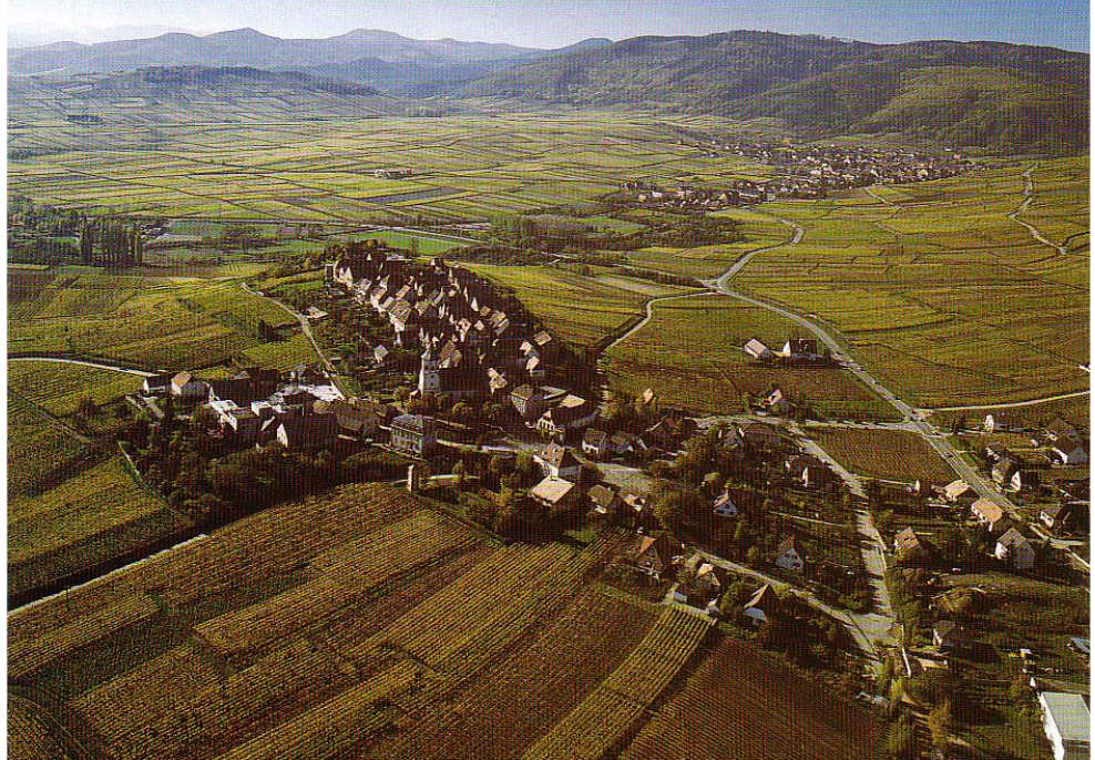
Doc. 1 : Village de Zellenberg, en Alsace.